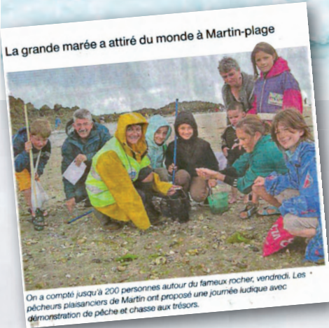
La grande marée a attiré du monde à Martin-plage

L'Association des Pêcheurs Plaisanciers de Martin Plage a décidé de s'investir dans cette opération à la demande du Comité Départemental 22.