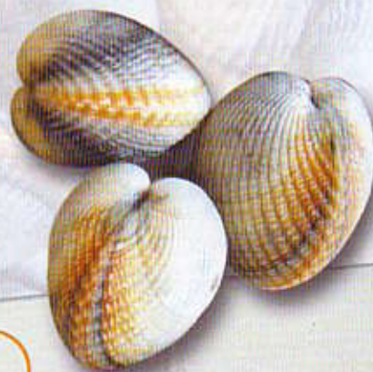
La commission Pêche à Pied

Vous qui lisez ces lignes, pensez que plus nous serons nombreux, plus nous pourrions nous défendre. Pêcheurs à pied de toutes régions, rejoignez-nous avant qu'il ne soit trop tard, aidez-nous à préserver l'accès au domaine public.