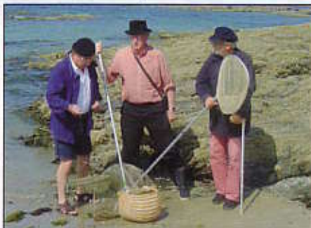
Malgré les promesses du Directeur des Affaires Maritimes de Cherbourg, la pêche au bouquet est

restée fermée tout le mois de juillet. C'est inadmissible. Nous allons une fois de plus intervenir auprès du Directeur des AFFMAR et des élus locaux afin que le 1 er juillet de chaque année soit la date d'ouverture de la pêche à pied au bouquet à l'aide du haveneau, du "pousseux" ou de la balance. Si nous n'obtenons pas satisfaction, il faudra nous dire pourquoi. Est-ce pour protéger la ressource ? Est-ce pour respecter les périodes de frai ? Est-ce pour limiter les prélèvements ?