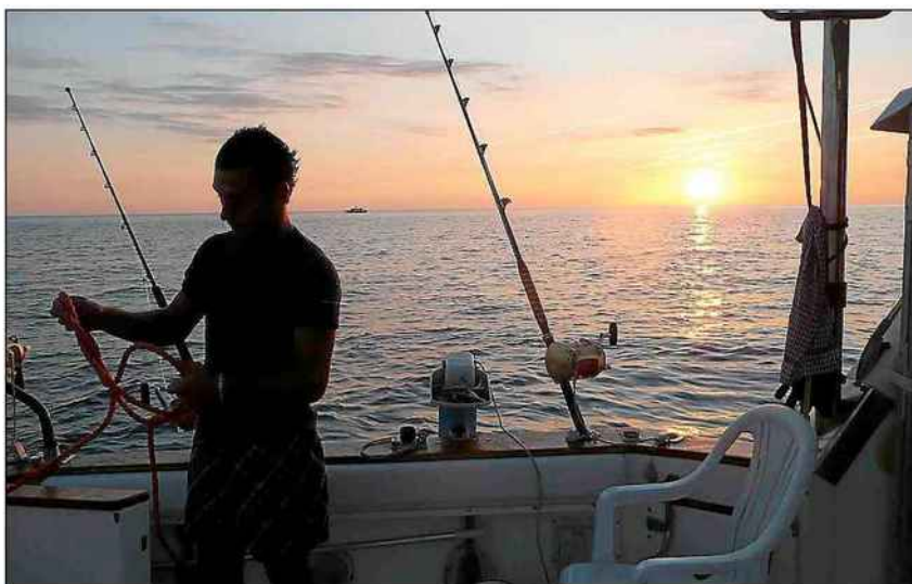
Les pêcheurs de loisirs demandent une réévaluation urgente de la pêche au thon rouge, au risque de voir la flotte s'amenuiser entraînant l'effondrement économique de cette filière.

Signataire en 2010 de la charte d'engagement pour une pêche de loisir en mer écoresponsable éla-