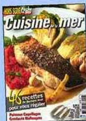
Hors série n°12 Cuisine de la mer 2013

L e bilan de la saison 2013, que nous dressaient récemment guides reconnus et pêcheurs de renom, était, dans la globalité, loin d'être mirifique. On s'en doutait un peu, car les conditions météo furent loin d'être des meilleures ; les quelques mois d'embellie n'auront pas suffi à effacer un premier semestre pourri sur une grande partie de nos côtes et un mois de décembre du même acabit. Cette fois, à leur tour, et d'une façon toute naturelle puisque non concertée, ce sont nos correspondants qui font le bilan de l'année écoulée. Et là encore, c'est loin d'être fameux ! Si le mauvais temps interdisant les sorties est ici aussi pointé du doigt, une autre constatation inquiétante revient : la nette diminution de certaines espèces de poissons ! Alors, on peut toujours se dire qu'ils n'étaient pas là, qu'ils reviendront et que ce sera de nouveau la fiesta à chaque coup de ligne, c'est vrai. Mais en est-on vraiment sûr quand on constate que mois après mois, année après année, les belles pêches régulières se raréfient ? Si je m'en réfère aux écrits de nos amis qui se trouvent en première ligne un peu partout sur nos côtes, il est grand temps de prendre conscience que la mer n'est pas inépuisable et que chacun s'applique à lui-même quelques règles, simplissimes, comme celle de respecter le frai, par exemple. Certes,