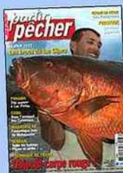
Partir Pêcher n°37 (Mars-Avril-Mai 2014)