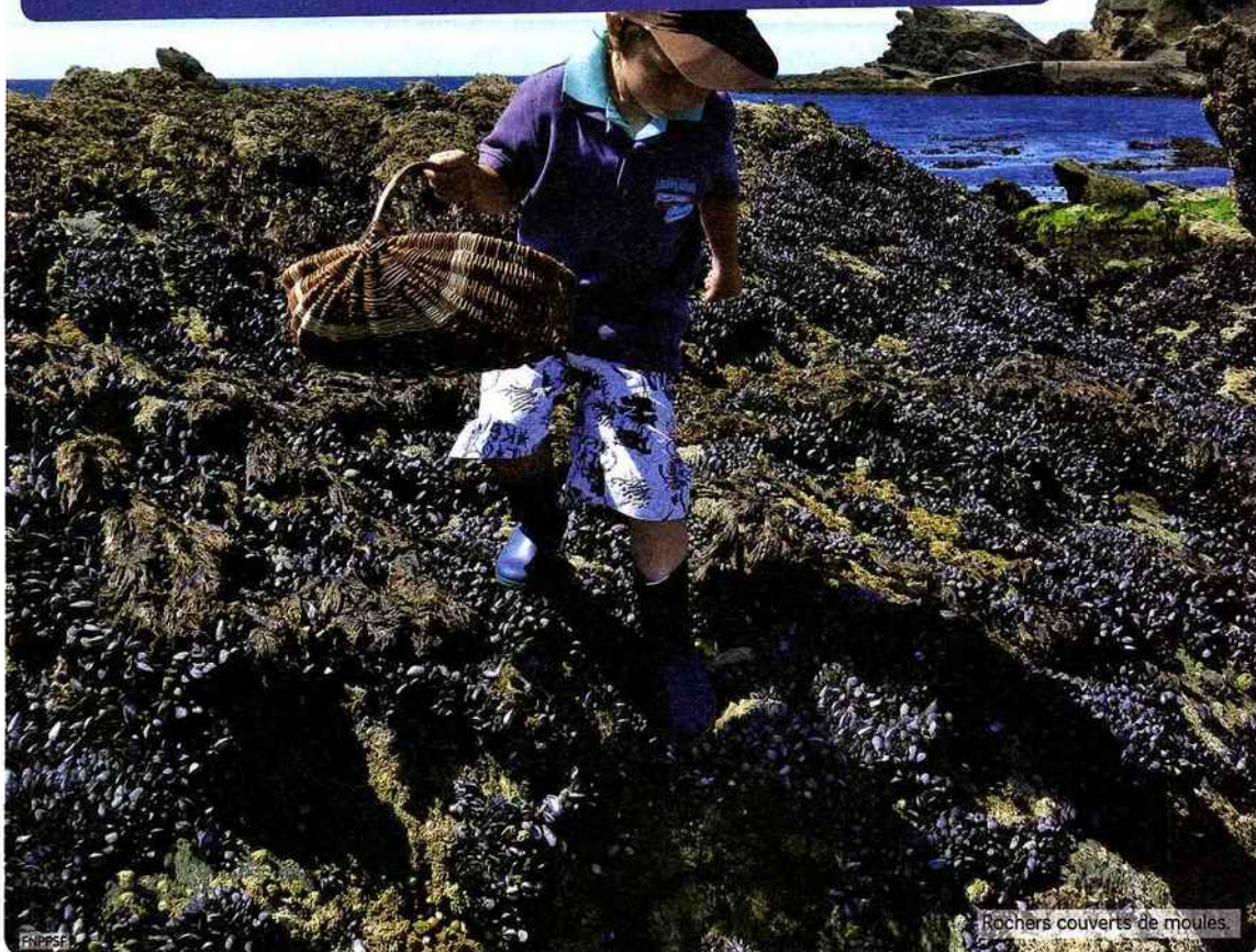
Rochers couverts de moules.

Quels sont les endroits pour pêcher à pied ? p. 2 : Des singes au comportement étrange p. 3