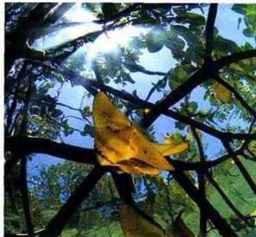
Yves Gillet nous propose ces "Soleils dans la mangrove"