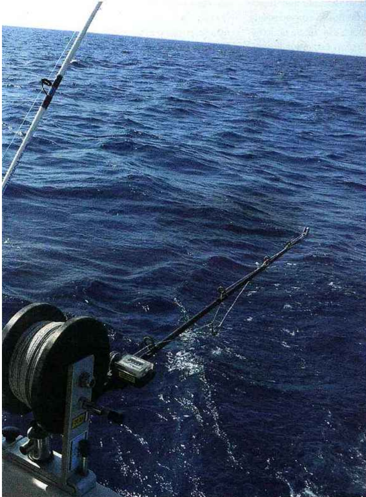
la pêche la plus pratiquée dans la région.