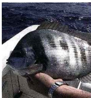
Dorade grise de Méditerranée.