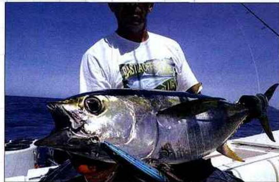
Le thon rouge étant plus que menacé, il est obligatoire de relâcher les prises.

La pêche à la traîne rapide hauturière consiste à traîner plusieurs leurres derrière un bateau de plus de 7 m évoluant à une vitesse de 5 à 10 nœuds, voire jusqu'à 12 nœuds. C'est