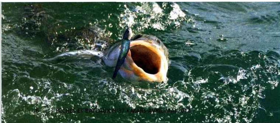
PECHES ET BATEAUX N° 3 - MARS - AVRIL - MAI 2012