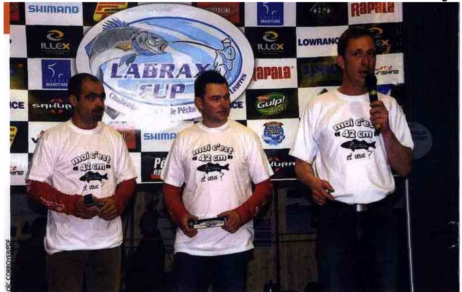
Parmi les propositions, le passage de la maille du bar à 42 cm au lieu de 36 cm dans l'Atlantique, une mesure très attendue des pêcheurs sportifs comme les compétiteurs du Labrax Cup.

Au premier rang des mesures responsables prônées par les fédérations, on trouve l'augmentation de la taille de capture pour le bar ( Dicentrarchus labrax ), que ce soit en Atlantique où elle pourrait passer à 42 cm au lieu de 36 ou en Méditerranée avec une hausse de 5 cm, passant ainsi de 25 à 30 cm. Il en va de même pour le cabillaud (de 35 à 42 cm), l'espadon (de 125 à 170 cm), le rouget-barbet (de 11 à 15 cm) ou encore la sole. En parallèle de ces propositions, les fédérations plaident également pour l'instauration de tailles minimales de capture pour des espèces qui n'étaient pas encore référencées comme le bar moucheté, le chapon, le congre, le corb, la daurade grise et rose, la daurade royale, la limande, la sole, la lotte, le maigre et la mostelle. Il en va de même pour les coquillages et crustacés comme la coquille Saint-Jacques, l'étrille, le bouquet, les crevettes, les coques et les palourdes.