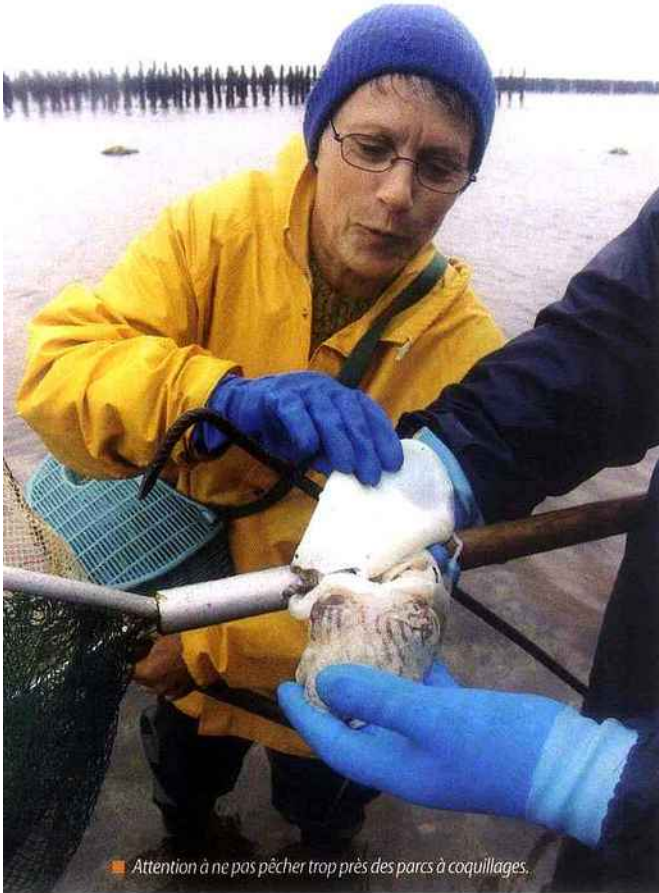
■ Attention à ne pas pêcher trop près des parcs à coquillages.